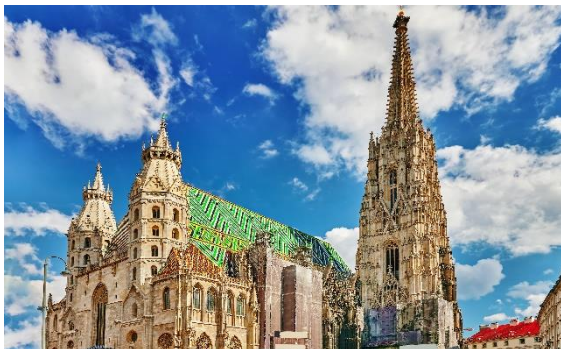
Katedrala svetega Štefana

Zgodba govori o krdelu mačjih klošarjev, ki imajo vidne človeške lastnosti, predstavljajo pa tudi stereotipe naše družbe in zahodne kulture. Liki so ustvarjeni tako, da bi v vsakem lahko našli osebo v resničnem svetu, ki bi posebljala te lastnosti. Mačke so za igralce zahtevna predstava; od akrobatskih spretnosti, gibljivosti in prožnosti do vrhunskega znanja petja, saj pojejo tudi izjemno zahtevne arije, kot je Memory . Za gledalce pa je muzikal Cats vedno vrhunsko glasbeno doživetje, veličastni gledališki spektakel; paša za oči in raj za dušo. UŽIVAJTE ... Z Rusko dačo tokrat v gledališču Ronacher na Dunaju.