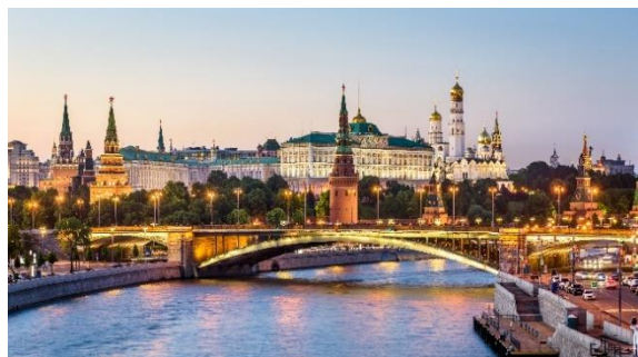
Pogled na Kremelj