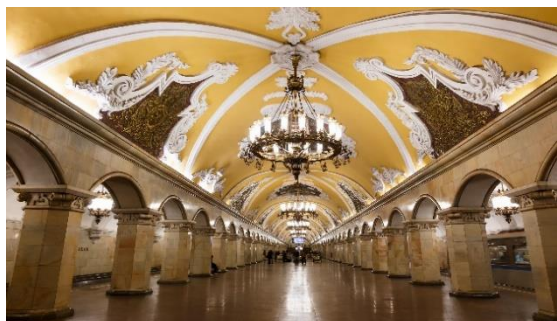
Podzemna železnica v Moskvi