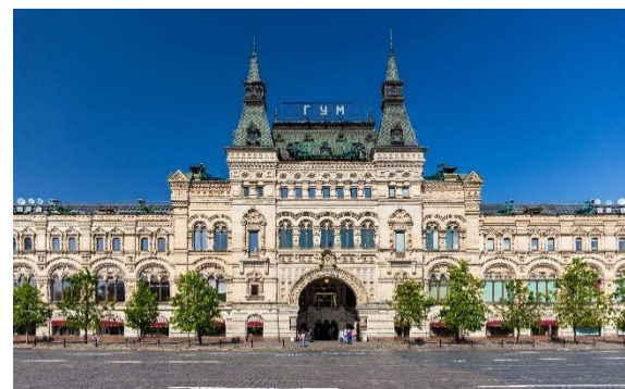
Nakupovalno središče GUM