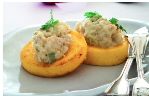
Bacala montesoto na polenti