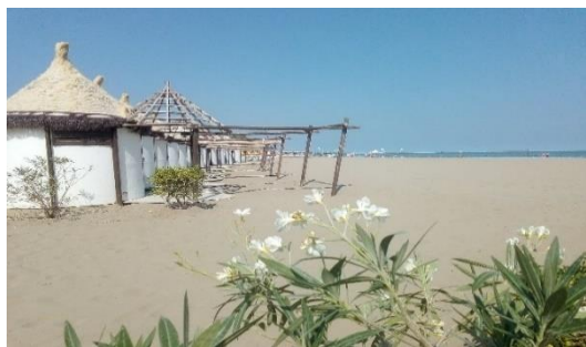
Dolce far niente