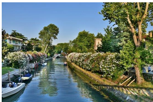
Med oleandri in vilami Lida