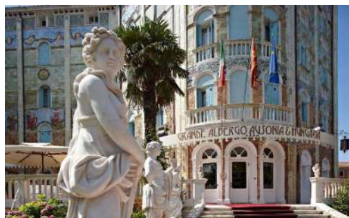
Hotel Ausonia Hungaria v slogu Liberty