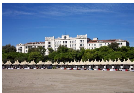
Hotel Des Bains spomni na Thomasa Manna