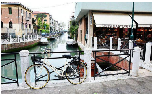
Med kanali s kolesom ali peš