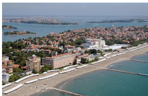
Lido - zelena pljuča Benetk