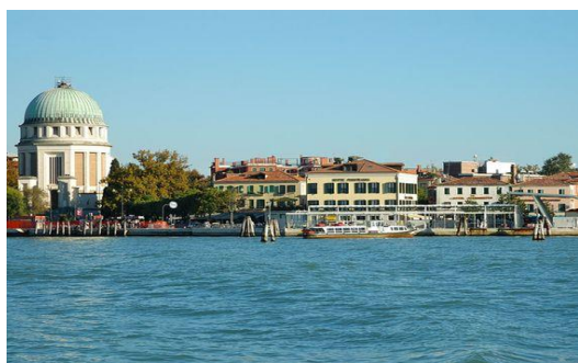
Z vaporetom le 15 minut do Benetk